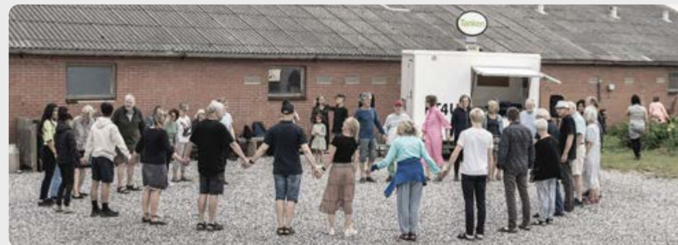
'Tanken' - nordisk og kurdisk folkedans i Fjaltring, 2021

Udstillingen flyttes efterfølgende til Stalden v. Fælleshuset i Fjaltring i Lemvig Kommune 11.10. - 9. 11. 2025, hvor 'cirkelns kvadratur' projekterne fra Mors følger med, og der lægges på med nye projekter realiseret i Lemvig Kommune.