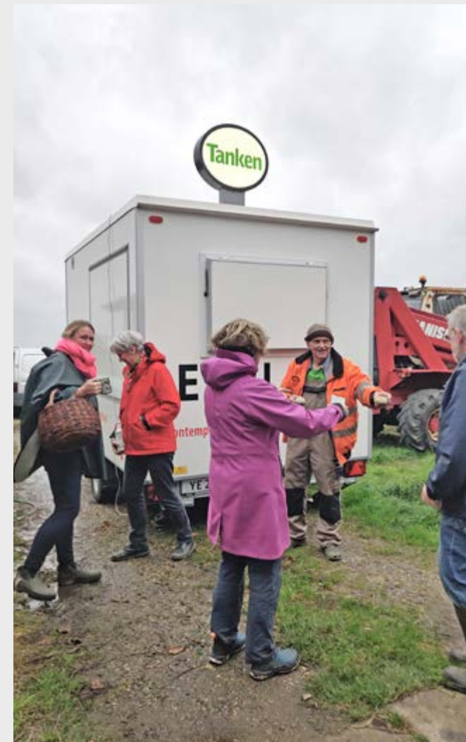
'Tanken' - om ikke at vende jorden - i Gudum 2021

Prøve på konceptet nov. 2024 vi har her klippet bogstaverne ud i papir på forhånd hvilket også kunne have været gjort under kameraet. :1,5 minut video